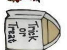
trick or treat bag