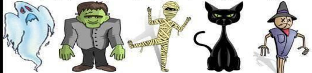
ghost Frankenstein mummy black cat scarecrow