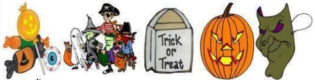
candies children trick or treat bag jack-o'-lantern mask