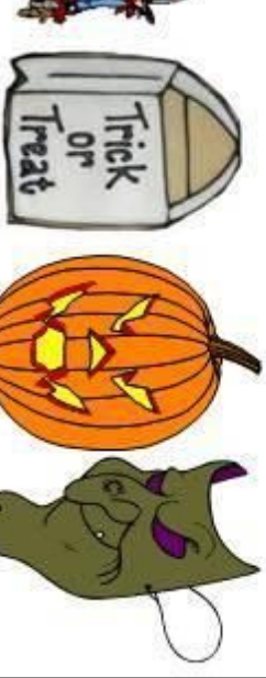
trick or treat bag