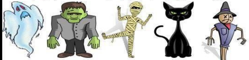
ghost Frankenstein mummy black cat scarecrow