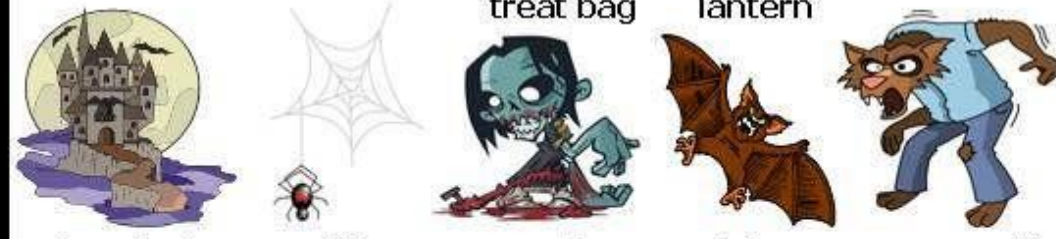
haunted house spider zombie bat werewolf