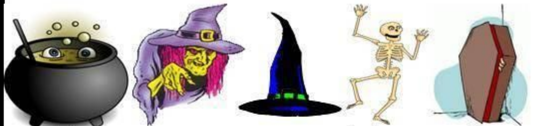
cauldron witch witch hat skeleton coffin