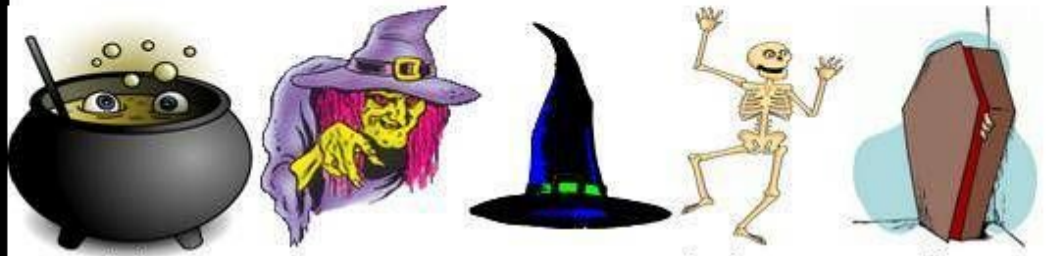
cauldron witch witch hat skeleton coffin