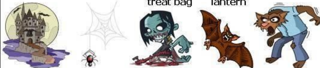
haunted house spider zombie bat werewolf