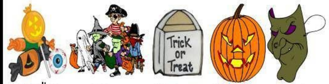
candies children trick or treat bag jack-o'-lantern mask